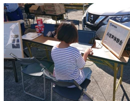
地域住民の皆さまにも AI 音声を体験いただき、NTT 東日本 群馬支店の取り組みをご紹介しました