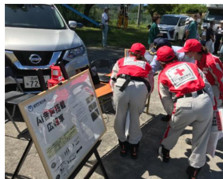
防災に関わる関係機関の皆さまに AI 音声の活用事例をご紹介しました