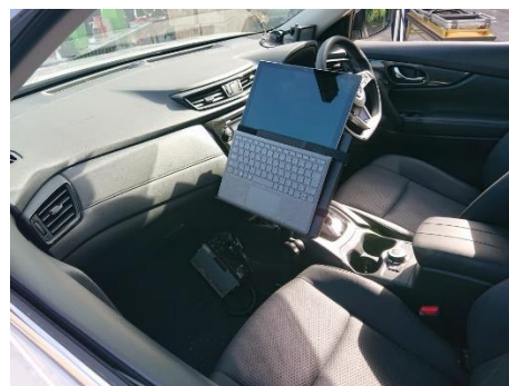
AI 音声搭載広報車を展示し AI 音声体験会も実施しました